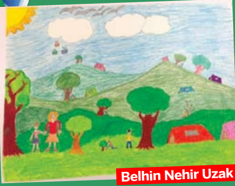
Belhin Nehir Uzak